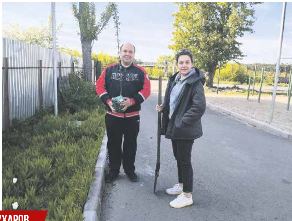
Фото из личного архива Александра Бухарова

Очень порадовала активность жителей дома, многие вышли на посадку целыми семьями, с детьми. Надеюсь, что также дружно жители будут поддерживать на аллее чистоту и порядок!